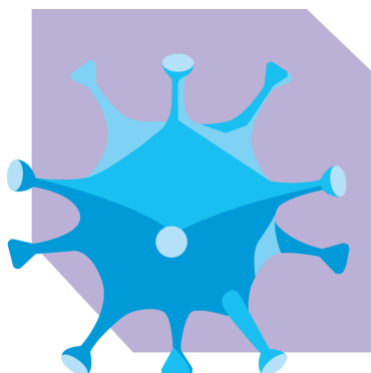
Síntomas de COVID-19

Aunque durante los pasados meses, la discusión se ha centrado en el desarrollo de la pandemia por COVID-19, los próximos meses, enfrentaremos otras enfermedades infecciosas de temporada. Es importante conocer que los síntomas podrían ser similares y que debemos estar alertas ante cualquier síntoma. Consulta con tu profesional de la salud si presentas alguno de estos signos de infecciones de temporada.