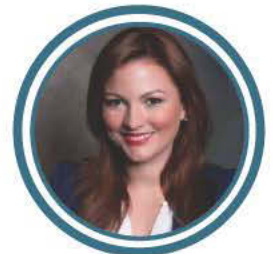
DENISSE RODRÍGUEZ FOUNDATION FOR PUERTO RICO

7:00 p.m. - 11:00 p.m. - Grand Atlantic Ballroom