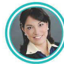
ELIZABETH PLAZA PHARMA-BIO SERV, INC.