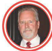
RICHARD P. LARKIN HERBERT J. SIMS & CO., INC.