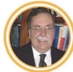
JOSÉ JOAQUÍN VILLAMIL ESTUDIOS TÉCNICOS, INC.