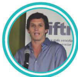
GUSTAVO VILLARES SOCIAL MEDIA, LLC GUSTAZOS.COM