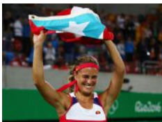
Llegó a Puerto Rico nuestra campeona olímpica Monica Puig