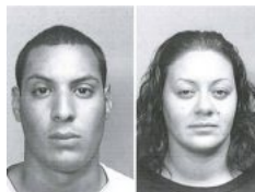
En prisión implicados en asesinato de expolicía