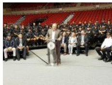
Superintendente presenta plan de seguridad ante alza criminal en San Juan