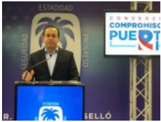
PNP rumbo a su Convención este fin de semana