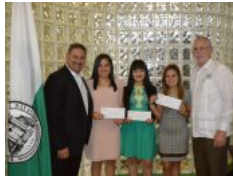
Estudiantes del RUM reciben beca de compañía puertorriqueña Rock Solid Technologies

Cien y todos nuestros proyectos comunitarios.