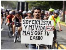
Policía de Puerto Rico concienciará sobre compartir vías con peatones y ciclistas